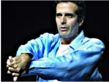
Auch die Tricks von David Copperfield lassen sich erklären