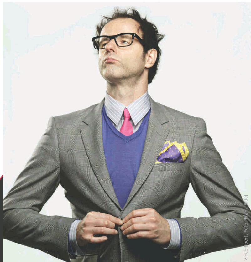
Vince Ebert

Anlässlich des 5. Jubiläumsjahres präsentiert Ihnen phäno im Oktober und November die Sonderreihe "Wissenschaft mit Witz". Besondere Persönlichkeiten, Naturwissenschaftler und Kabarettisten, die sich für spannende und unterhaltsame Wege der Wissensvermittlung engagieren, sind im phäno zu Gast.